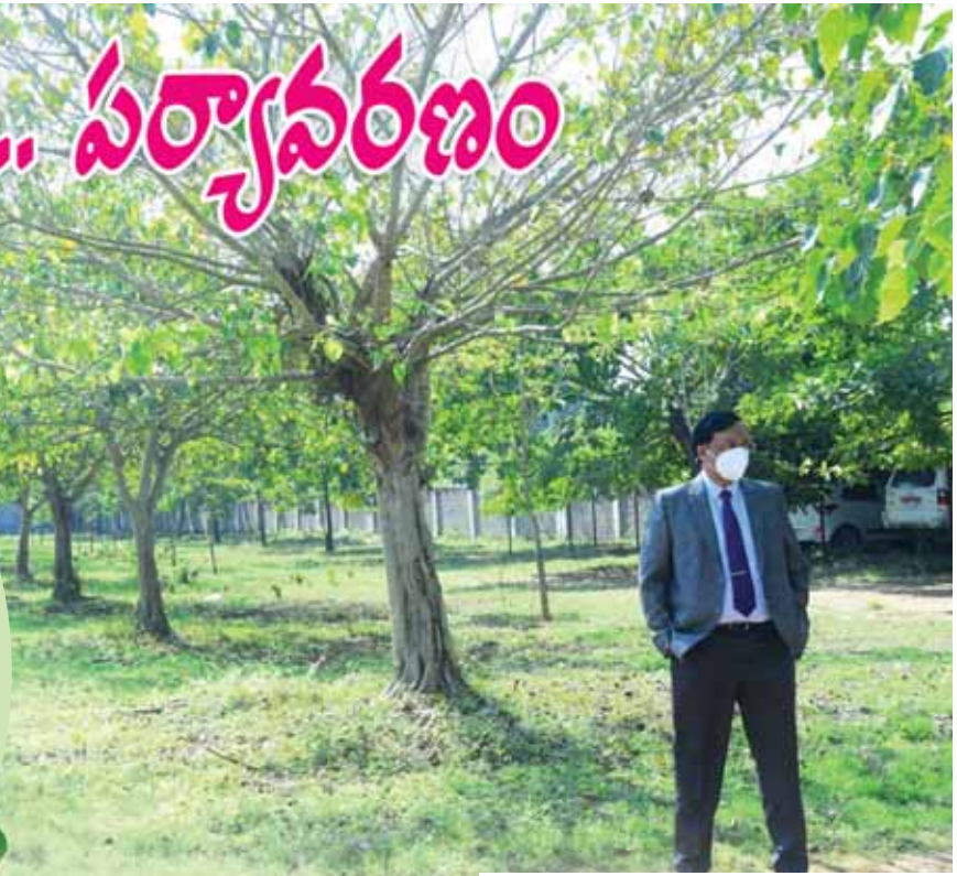
అశ్వత్థం (రావి), కరంబ వృక్ష శ్రేణి

మొక్కే ప్రాణాధారం! ఈ ప్రాంగణంలో గడ్డిమొక్క కూడా అందమైన దృశ్యమే. ఇక్కడ ప్రతి మొక్క ఒక పసిపాప బోసి నవ్వు. ఇక్కడ అడుగు పెట్టే సరికి ప్రతి మనిషి పర్యావరణంతో మమేకమౌతాడు. కవి అవుతాడు. పసిపిల్లవాడౌతాడు. సూర్య చంద్ర కిరణాలు ఇక్కడి వరకు తెల్లగా ప్రకాశించి నేలపైకి వచ్చేసరికి ఆకుపచ్చగా మారిపోతాయి. పచ్చాపచ్చని వెలుగు, వెన్నెల అవుతాయి. ఈ చెట్ల మధ్య, చిగుళ్ల మధ్య మనిషి నిజమైన మానవత్వాన్ని ఆవిష్కరించు కోవాలి. జ్ఞానాన్ని సంపాదించుకుని పరమ పట్టభద్రుడై సమాజ సర్వతోముఖాభివృద్ధి వైపునకు అడుగులు వేయాలి. ఇది విశ్వవిద్యాలయ ప్రాంగణం ఉద్దేశం.. ఆశయం.. ఆలోచన!! “చిగుళ్ల ఎర్రదనంతో, పువ్వుల తెల్లదనంతో, ఆకుల పచ్చదనంతో ఉంటుంది మొక్క. అందుకే మొక్క “భారత జాతీయ పతాక!” అన్నారు కరుణశ్రీ జంధ్యాల పాపయ్య శాస్త్రి గారు. మర్రి, వేప, రావి, మోదుగ, కరంబం, దేవకాంచనం, బోగన్విల్లా, పొగడ, తురాయి, ఫాక్స్ ట్రైల్, కానుగ, కాడమల్లి, ఎవెన్యూ మొక్కలు విశ్వవిద్యాలయ ప్రాంగణంలో చల్లని నీడను, ప్రాణవాయువును అందించే అపురూపమైన వృక్షజాతి. వీటి నీడన విద్యార్థిగణం తమ భవిష్యత్ ప్రణాళికల్ని రచించుకుంటుంది.