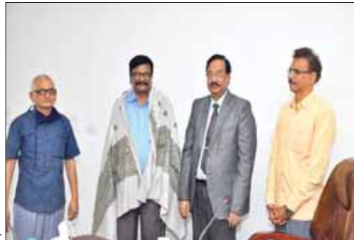
కృష్ణమూర్తిని సన్మానించి అభినందిస్తున్న వీసీ

అనుభవాలను, సూచనలు, సలహాలు తీసుకొని త్వరితగతిన నాక్ గుర్తింపు సాధించాలని చెప్పారు. నాక్ గుర్తింపునకు అవసరమైన సెల్స్ స్టడీ రిపోర్ట్ ను సమర్పవంతంగా తయారు చేయాలని తెలిపారు. నన్నయ విశ్వవిద్యాలయానికి ఉన్న విలువైన ప్రత్యేక అంశాలను సెల్స్ స్టడీ రిపోర్టులో వచ్చే విధంగా ప్రత్యేక దృష్టి సారించాలని చెప్పారు. కన్ఫరెన్స్ ఆచార్య వి.కృష్ణమూర్తి అనుభవాలను పూర్తిస్థాయిలో ఉపయోగించుకోవాలని విశ్వవిద్యాలయ అధికారులకు సూచించారు. ఈ సందర్భంగా వీసీ ఆయన్ను శాలువాతో సన్మానించారు