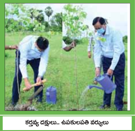
కర్తవ్య దక్షులు.. ఉపకులపతి వర్యులు