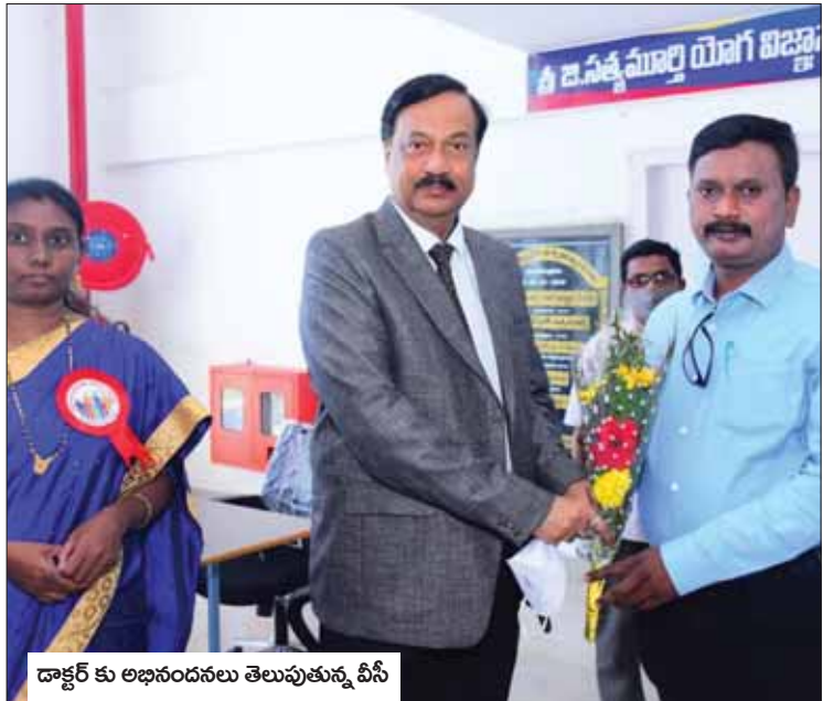
డాక్టర్ కు అభినందనలు తెలుపుతున్న వీసీ